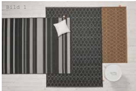
Raffi facet vision