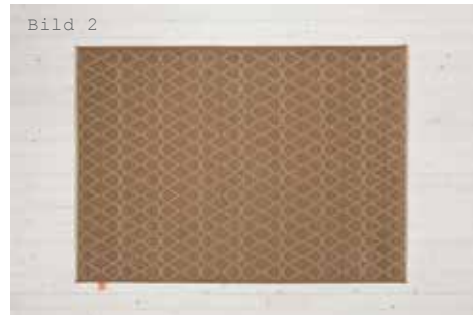
Raffi facet linen