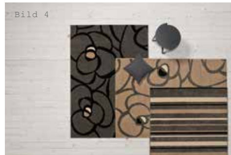
Raffi rose landscape